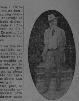
GENERAL DON VENUSTIANO CARRANZA

Recientemente reproducimos nosotros una noticia sumamente grave, que apareció publicada en el "New York American"; la de que Carranza habia expulsado al Ministro de Guate