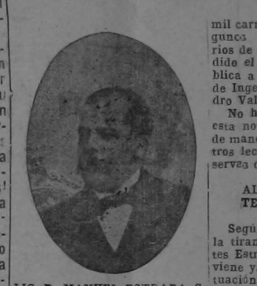
LIC. D. MANUEL ESTRADA C. Presidente de Guatemala

Desde hace algunos días corre con insistencia en esta capital el rumor de que las relaciones entre el Gobierno del Presidente Estrada Cabrera de Guatemala y el del General Venustiano Carranza, de México, se encontraban en un periodo de gran tirantez y se consideraba posible que de un momento a otro se romperían las hostilidades.